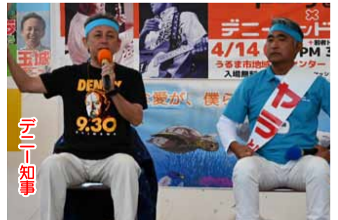
若者の力で沖縄から日本の政治を変えていこう